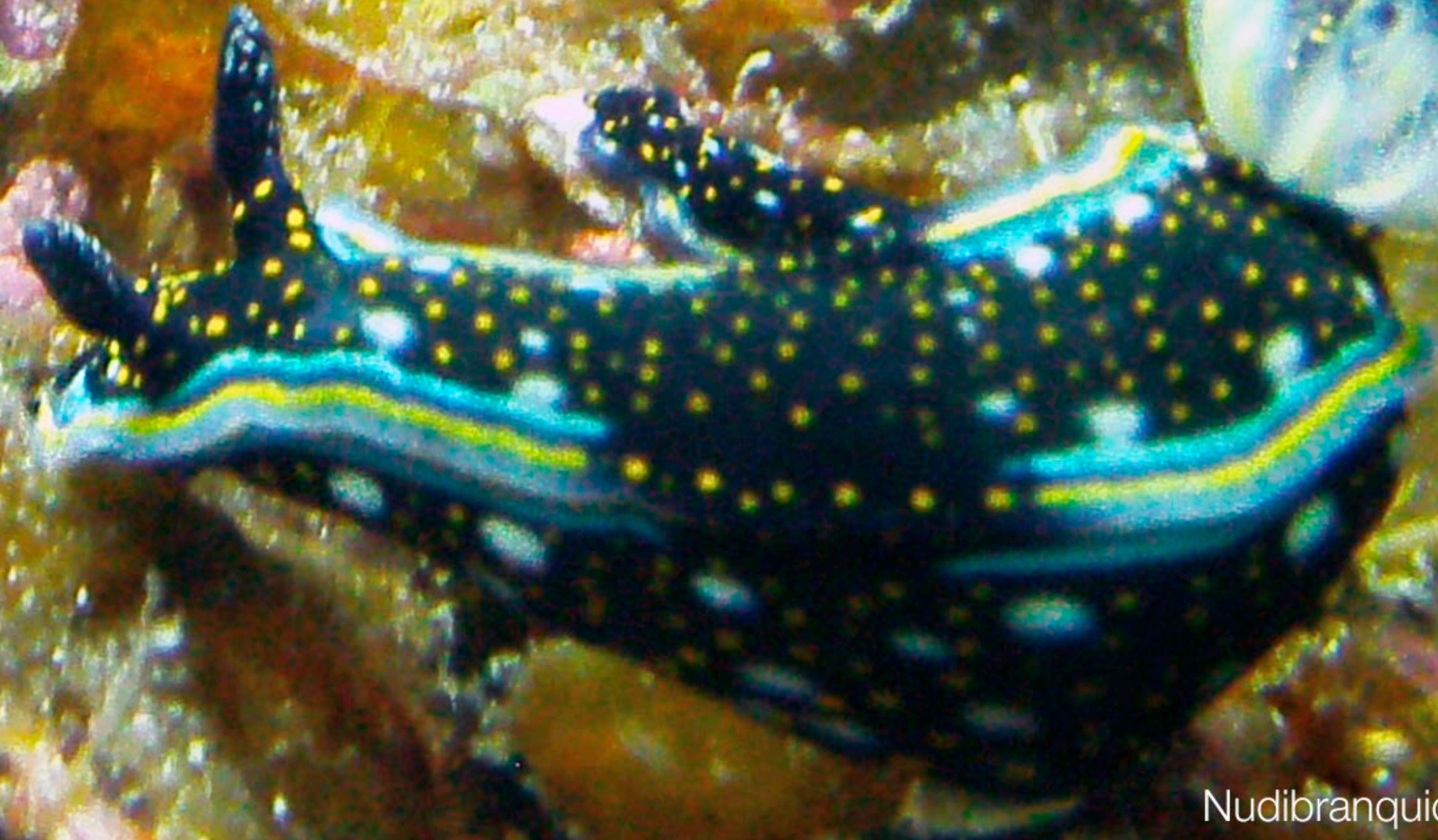
Nudibranchios ( Hypselodoris agassizii )