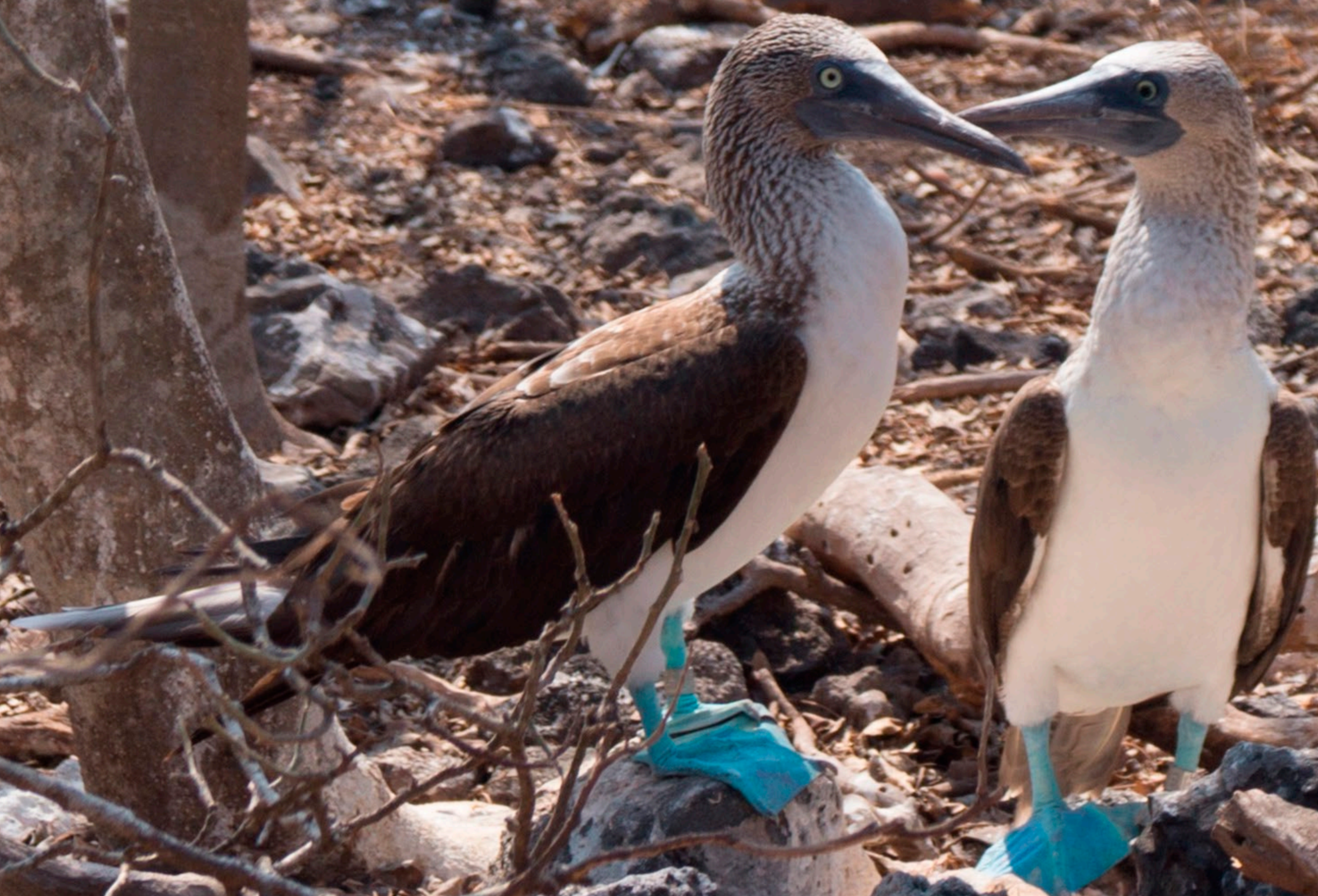
Bobo de patas azules ( Sula nebouxii )

Se han registrado 92 especies de aves, destacan nueve especies de aves marinas que anidan en grandes colonias; el bobo de patas azules ( Sula nebouxii ), el bobo café ( Sula leucogaster ), el bobo de patas rojas ( Sula sula ), el pelícano café ( Pelecanus occidentalis ), la fragata o tijereta ( Fregata magnificens ), el ave del trópico o rabijunco ( Phaethon aethereus ), la gaviota parda ( Larus heermanni ), la pericota ( Sterna fuscata ) y la golondrina café o golondrina boba ( Anous stolidus ).