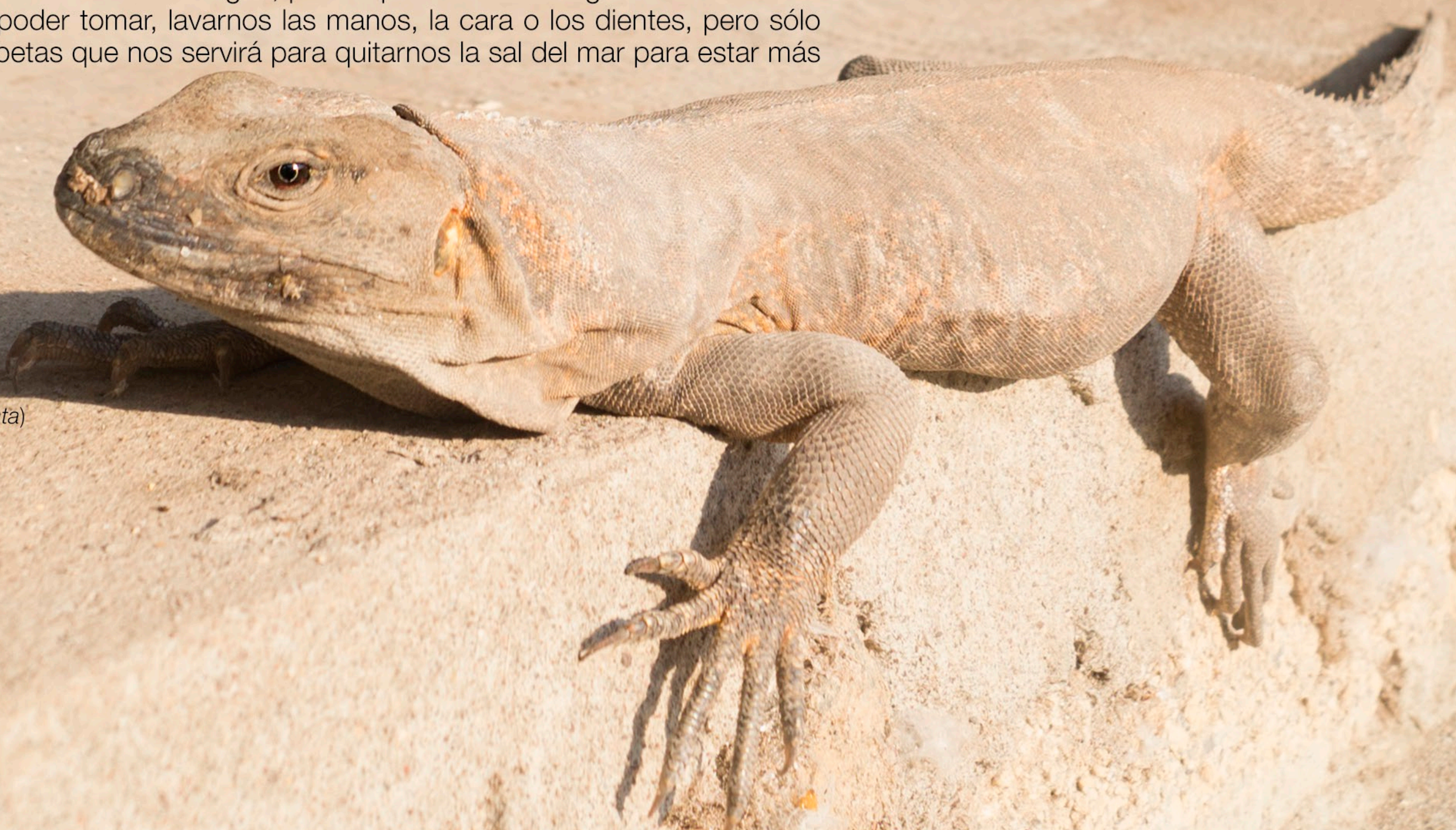
Iguana café ( Ctenosaura pectinata )